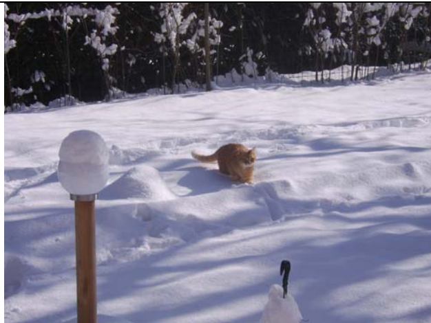
Et elle est restée... (Cain brave la neige)