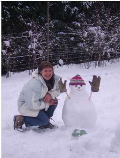
Mais Donna a prié que la neige vienne – une grande gamine vraiment!!