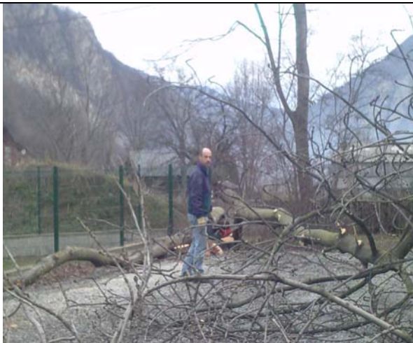
Nous avons fait abattre deux arbres juste après Noël. Des amis nous ont aidés. Il reste toujours le sciage pour le brûler dans notre poêle à bois.