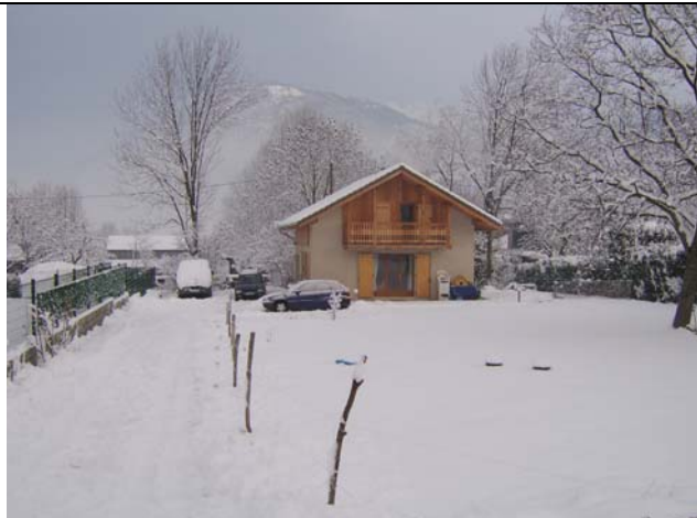
La neige est venue...

Et voici nos trois derniers mois en image – tellement de neige!