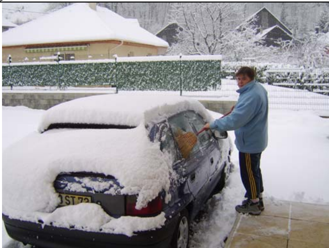
Plus de neige... Le déneigement continue